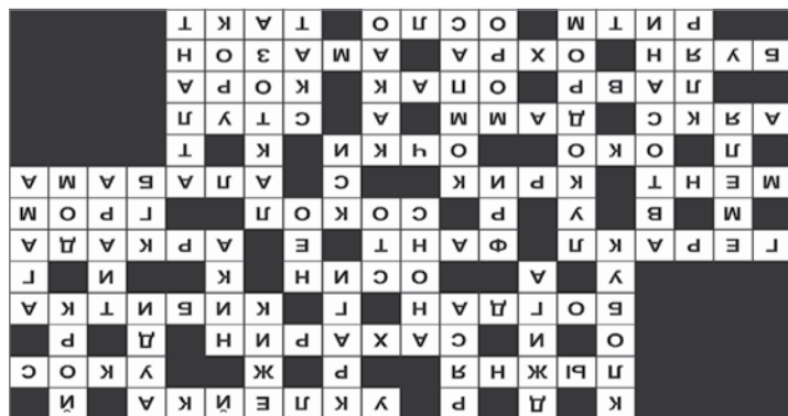
Ответы на сканворд