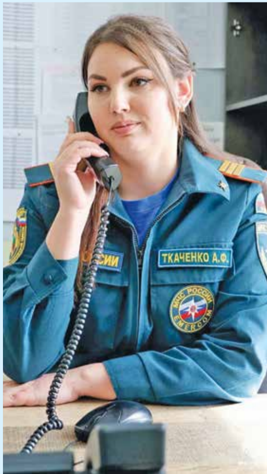
Мы хотим сказать спасибо тем, кто стоит на страже нашего спокойствия.