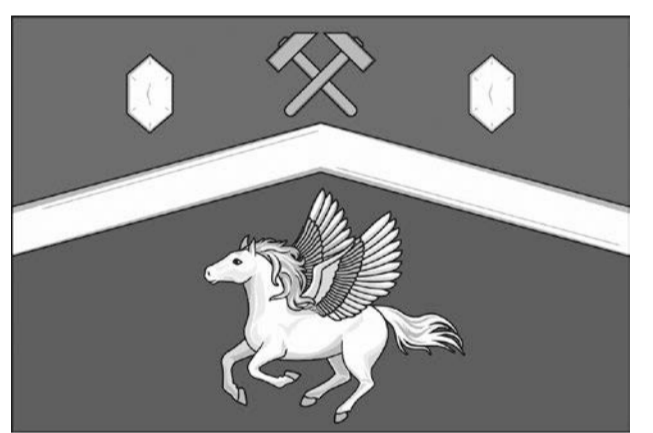
Флаг Пологовского муниципального округа Запорожской области (цветное изображение)