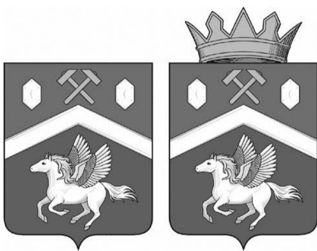
ПРИЛОЖЕНИЕ 1.2 к Положению об официальных символах (гербе и флаге) Пологовского муниципального округа Запорожской области